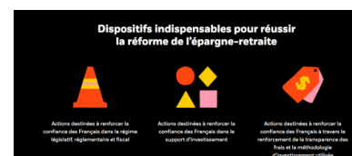
Les recommandations de BlackRock en images.

C'est cette gestion risquée de l'épargne que le gouvernement français accepte de soutenir dans sa promotion de la capitalisation. Officiellement, cela est censé aider le développement de l'épargne productive et le financement des PME. Mais les demandes de BlackRock au gouvernement vont tout à fait dans un sens opposé. Les produits d'épargne retraite, promus dans le cadre de la loi Pacte, doivent s'inscrire, recommande le gestionnaire, dans le cadre de la directive Juncker sur l'épargne paneuropéenne. Dans ce cadre, « la liste des investissements éligibles aux dispositifs d'épargne salariale gagnera à être étendue aux SICAV de droit étranger. [...] Un grand nombre de gestionnaires d'actifs ont des gammes de fonds domiciliées au Luxembourg ou en Irlande, qui sont aujourd'hui exclues de cette offre. » Deux pays à la fiscalité "compréhensive". En d'autres termes, il faut faciliter l'évasion fiscale et la fuite des capitaux. Sans que cela fasse frémir un seul responsable.