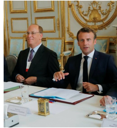
Larry Fink (BlackRock) et Emmanuel Macron à l'Élysée en juillet 2019

la France et de l'Europe ». Macron « bluffe l'homme le plus puissant de Wall Street », écrira quelques semaines plus tard Challenges .