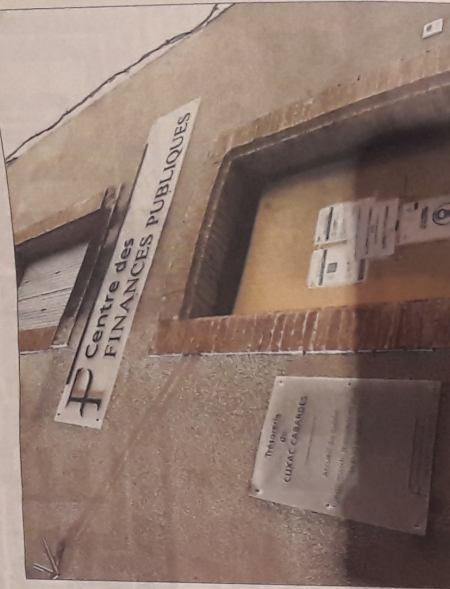
► En milieu rural, les perceptions ferment les unes après les autres, comme ici à Courz-Cabardès

Pour marquer son opposition à cette réorganisation, l'intersyndicale appelle à deux rassemblements réunissant aussi « élus et population » : le premier à Leucate le mardi 21 septembre, le second à Durban le 28. Toulouse à 11h 30, et toujours, bien sûr, devant les trésoreries. Mais CGT, FO et Solidaires veulent aller plus loin, en organisant